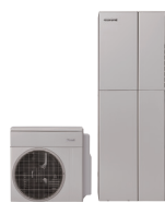
ハイブリッド 給湯器