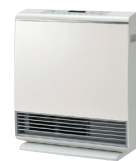
暖房機 (ストーブ、ファンヒーター)