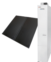
太陽熱利用 給湯器