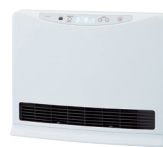
温水ルーム ヒーター