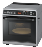
オープン・ 高速レンジ